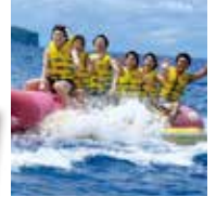
ウォータートーイ ウェイク ・ウェイクボード 85$ ・バナボート 45$ ・各チューブ 45$