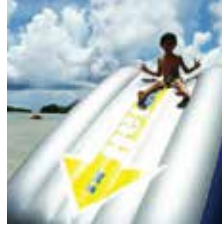
アクティビティ ・ウォータースライダー ・水上トランボリン