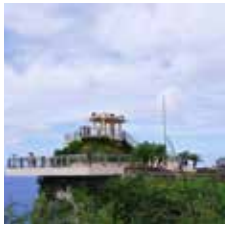
オリジナルツーリング