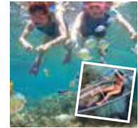
シュノーケリング 20$ クリアカヌー 35$