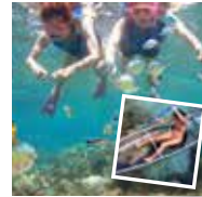
シュノーケリング 20$ クリアカヌー 35$