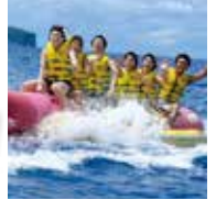
ウォータートーイ ウェイク ・ウェイクボード 85$ ・バナボート 45$ ・各チューブ 45$